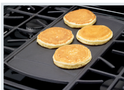
Plaque chauffante comprise