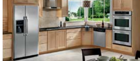
Table de cuisson