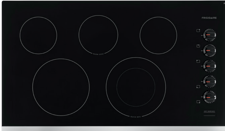
TABLE DE CUISSON ENCASTRABLE ÉLECTRIQUE DE 36"